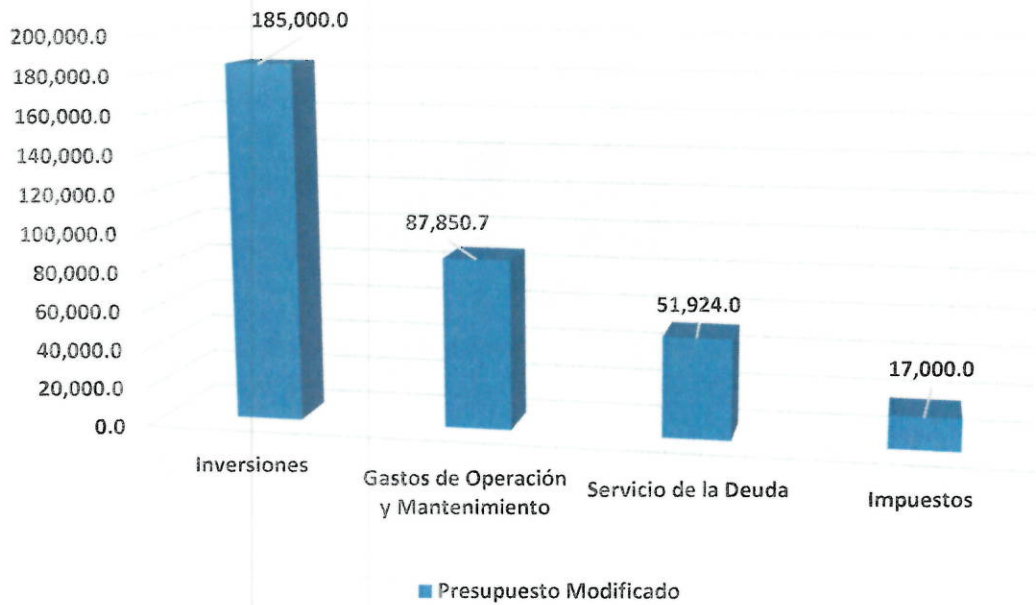
Gráfica No. 1 Presupuesto Modificado a Julio 2023