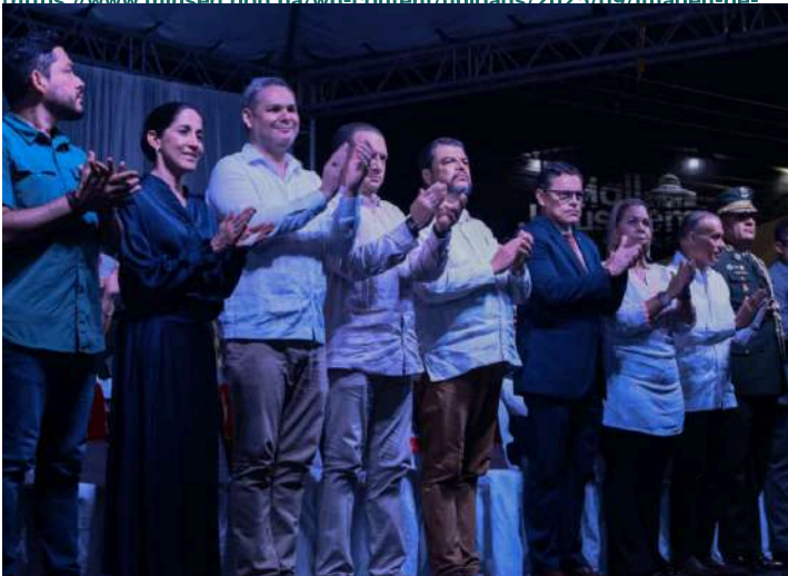
( https://www.minseg.gob.pa/wp-content/uploads/2025/09/Imagen-de-WhatsApp-2025-09-12-a-las-21.55.34_f790fdbe.jpg )