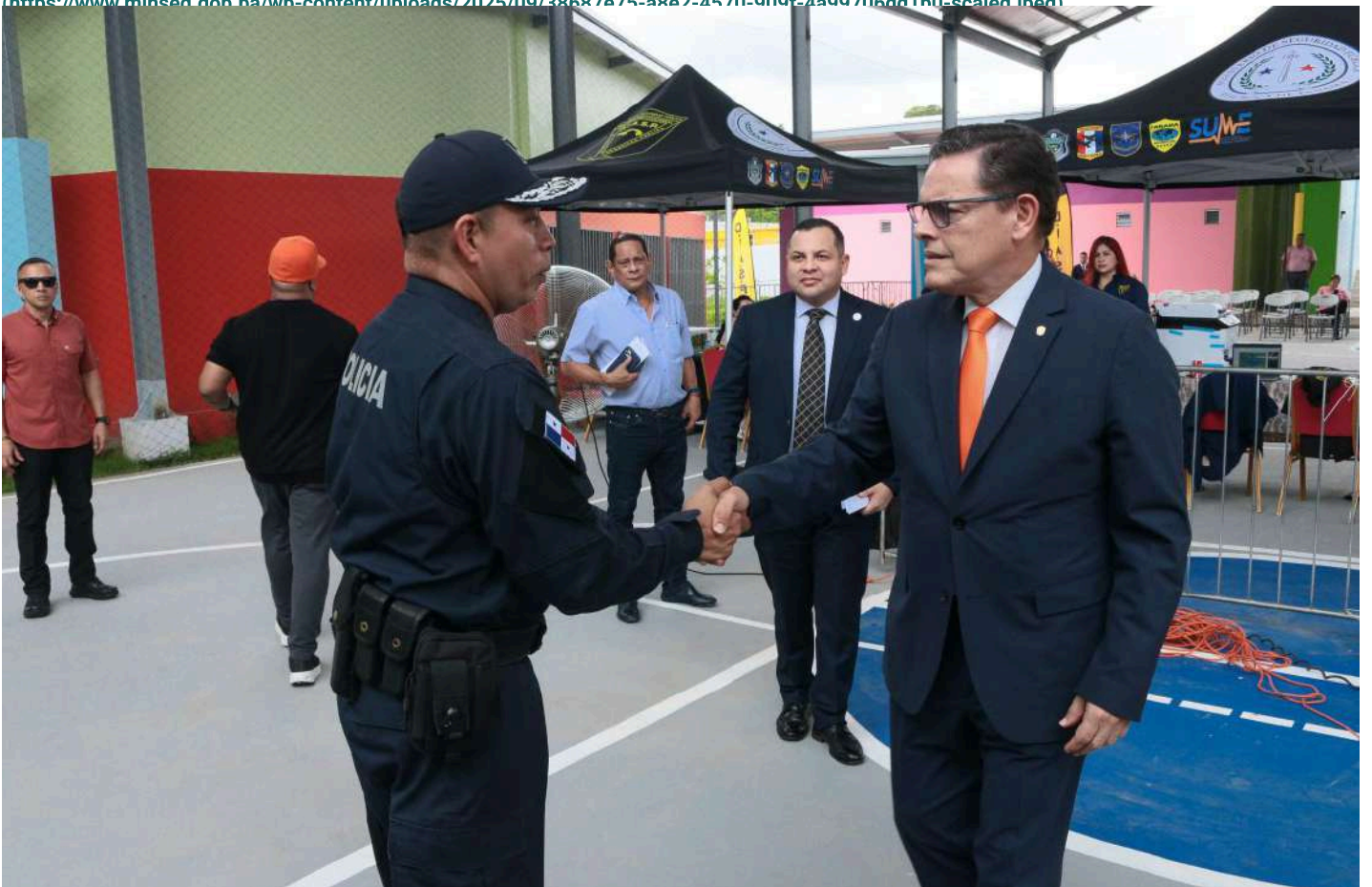
( https://www.minseg.gob.pa/wp-content/uploads/2025/09/32aaa706-8912-41cb-9a82-4711e06f7f00-scaled.jpeg )