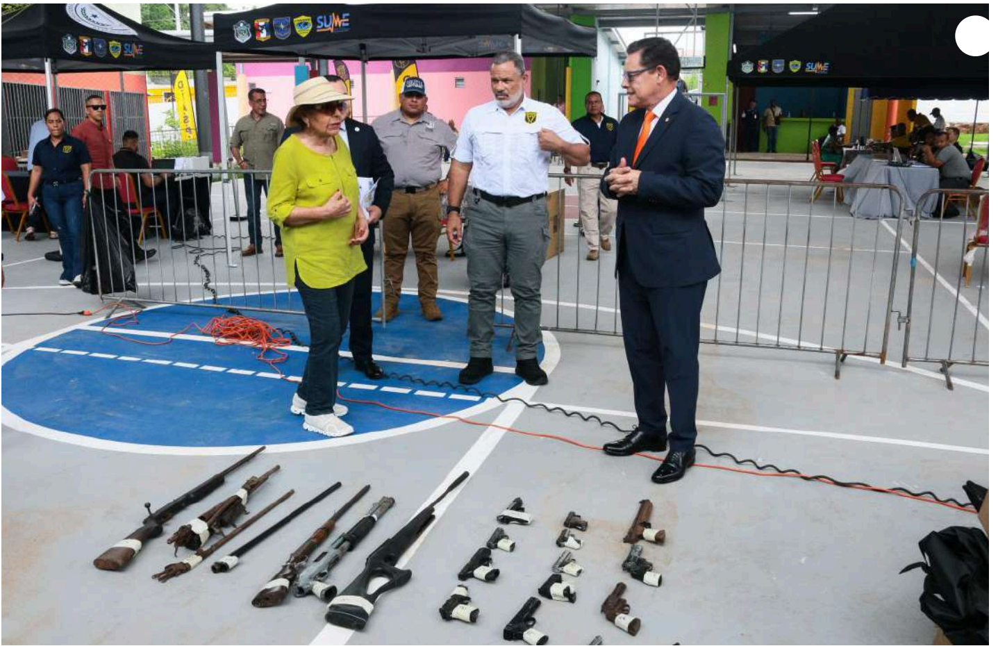
( https://www.minseg.gob.pa/wp-content/uploads/2025/09/aeec1f47-4f9a-4355-a185-6145f7f0beb1-scaled.jpeg )