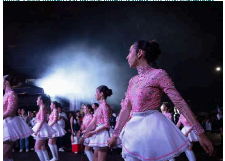
( https://www.minseg.gob.pa/wp-content/uploads/2025/09/Imagen-de-WhatsApp-2025-09-12-a-las-21.55.11_482158ff.jpg )