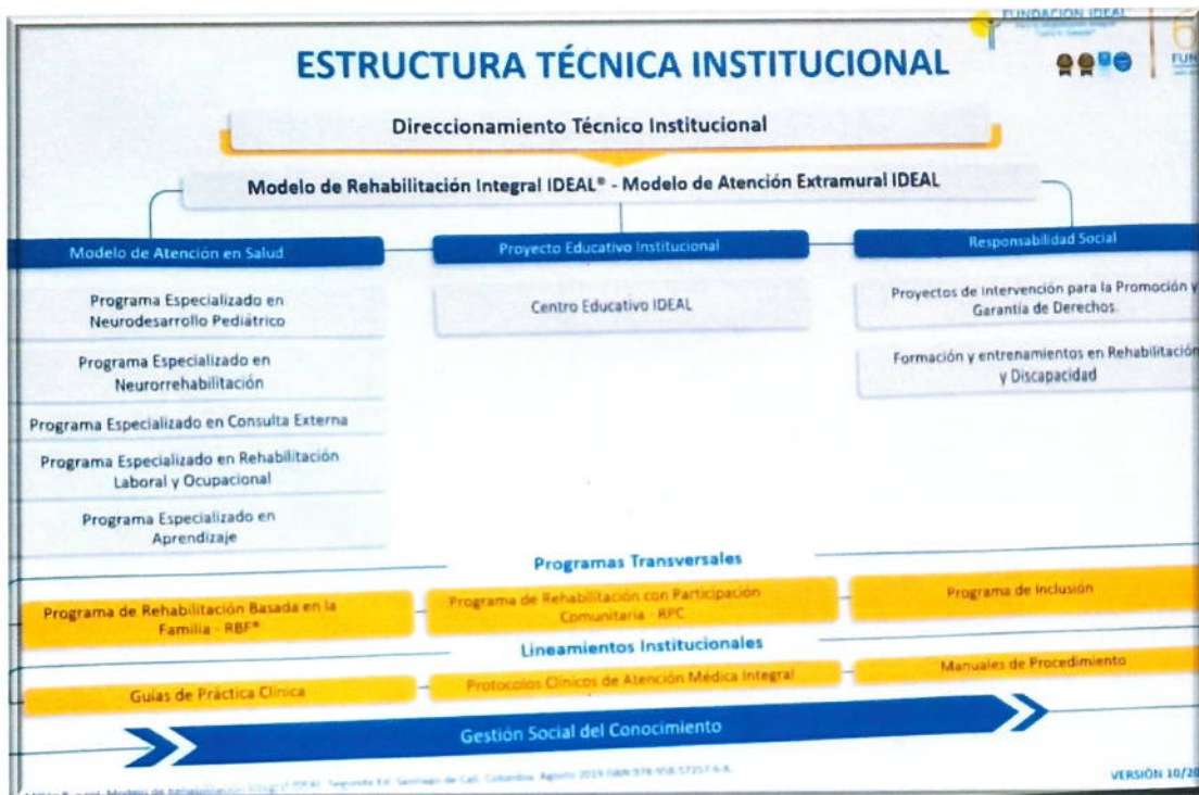
Estructura técnica de la institución