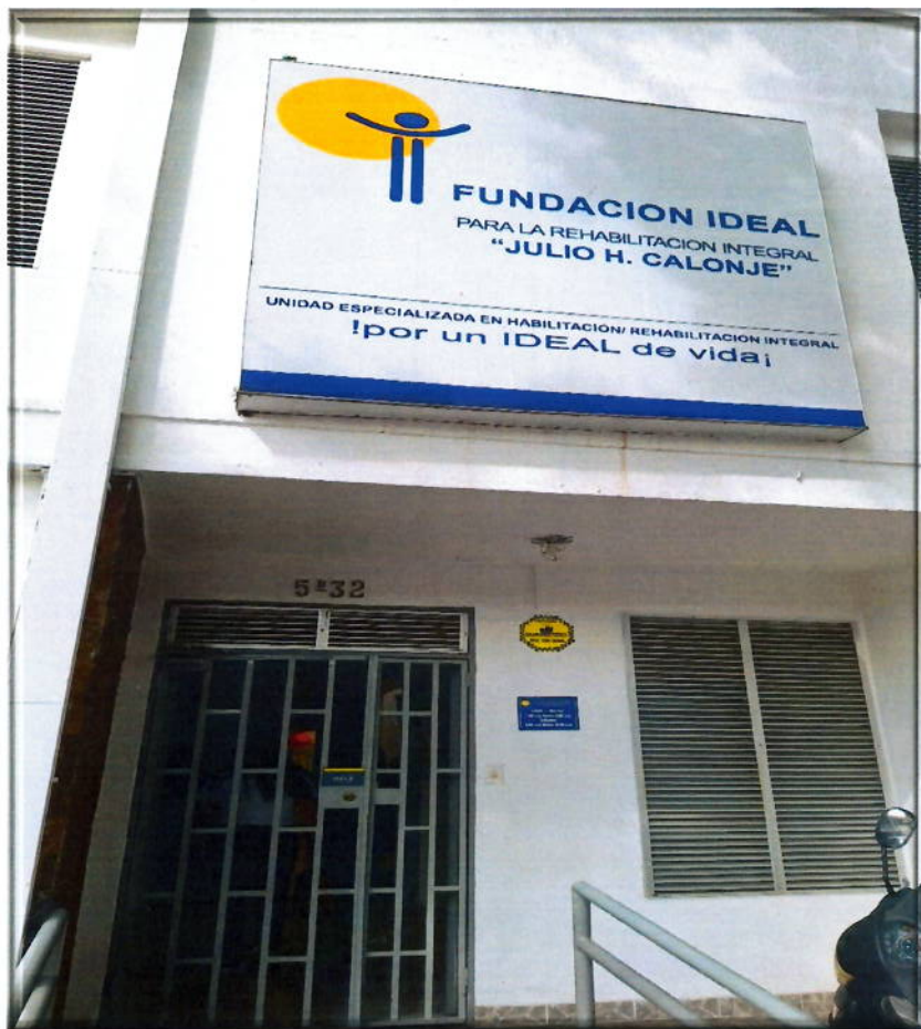
Centro Comunitario de Rehabilitación CCR