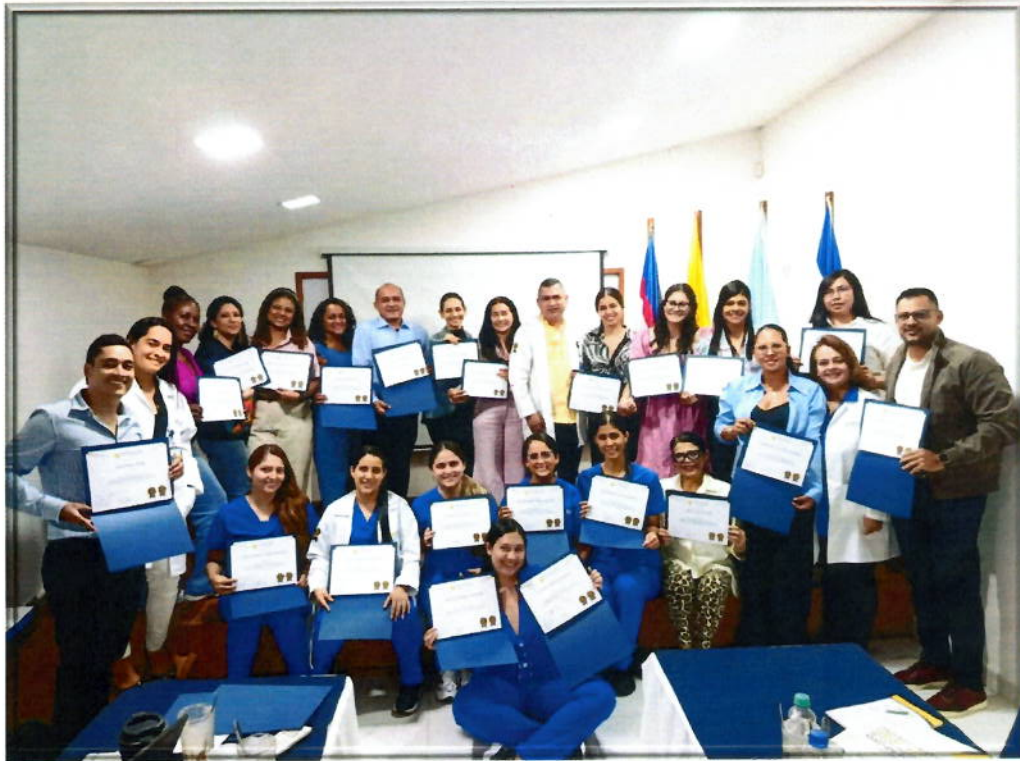
Participantes del VI curso, recibiendo sus certificados.