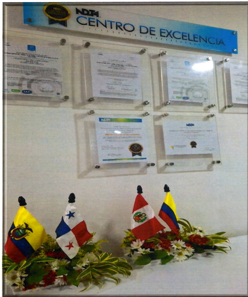
Países participantes del VI curso modelo de Rehabilitación Integral IDEAL.