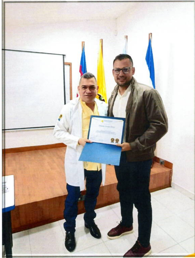
Entrega de certificados a los participantes del curso.