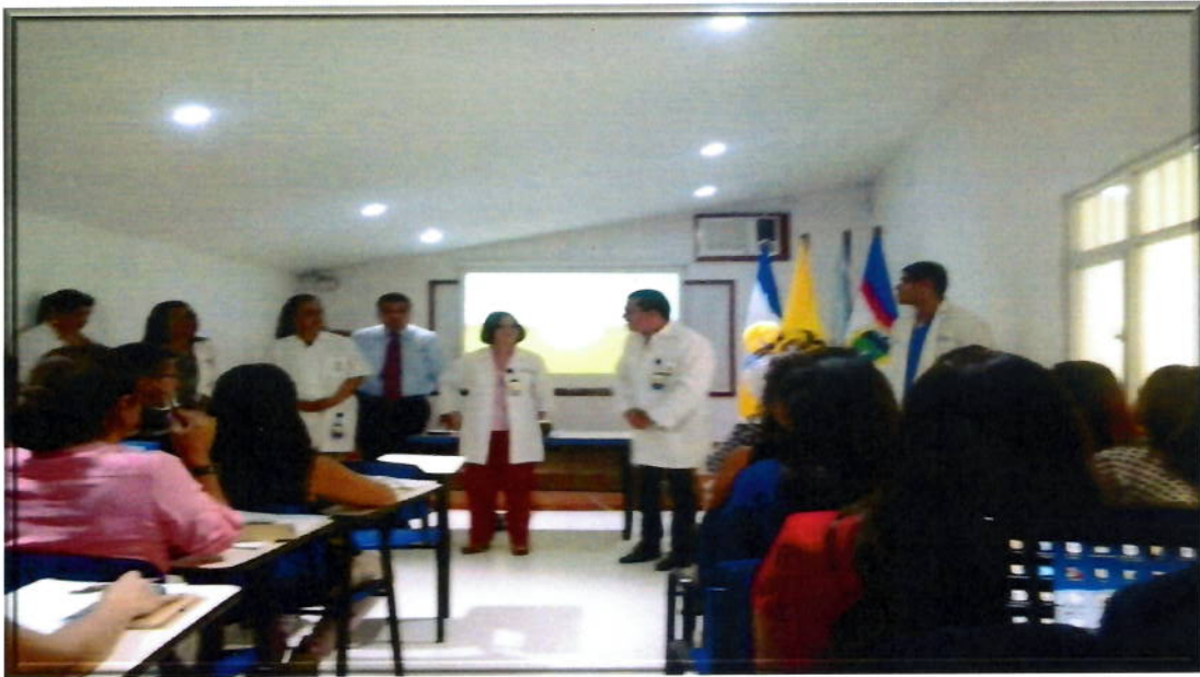
Ponencias del equipo de la Fundación: Director ejecutivo, fonoaudiólogos, fisioterapeutas, terapeutas ocupacionales, trabajadores sociales, psicólogos, docentes, personal médico y personal de apoyo.