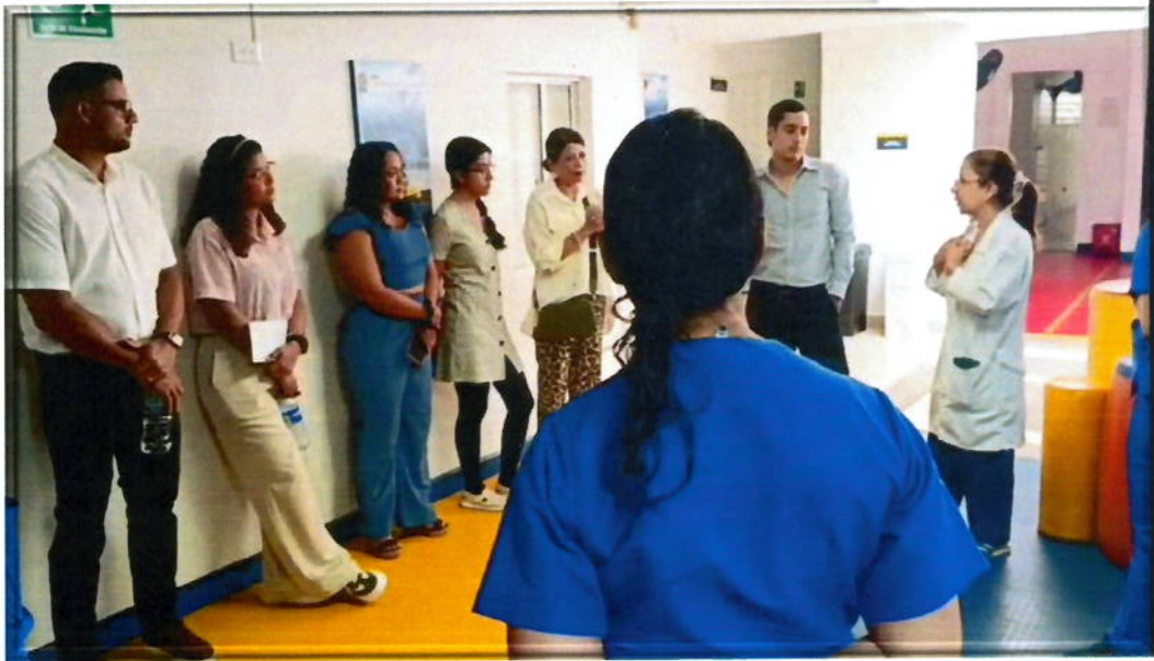
Inducción en el centro de neurodesarrollo por parte de la fisiatra encargada