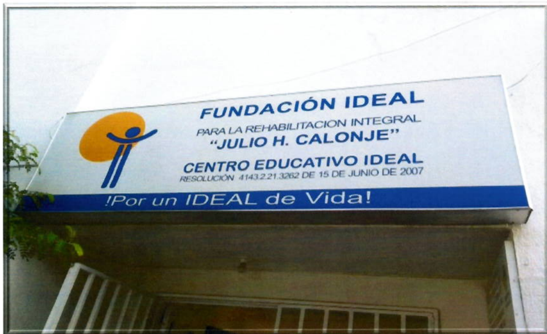
Fundación IDEAL, entidad privada sin ánimos de lucro, fundada en abril de 1956 por el club rotario de Cali.