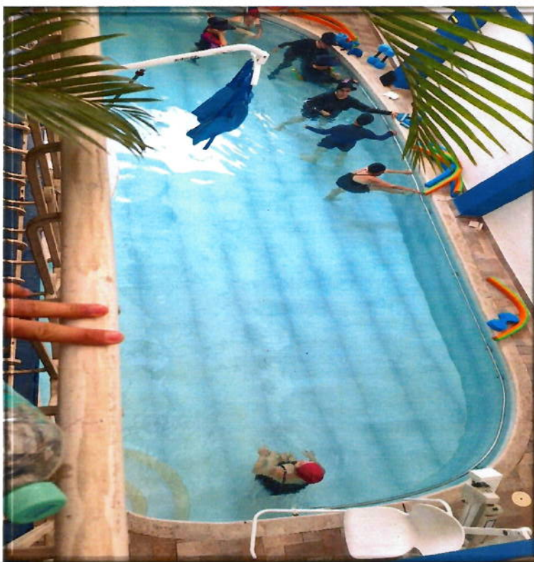
Intervención desde la modalidad de hidroterapia a personas con lesiones musculoesqueléticas y neuronales