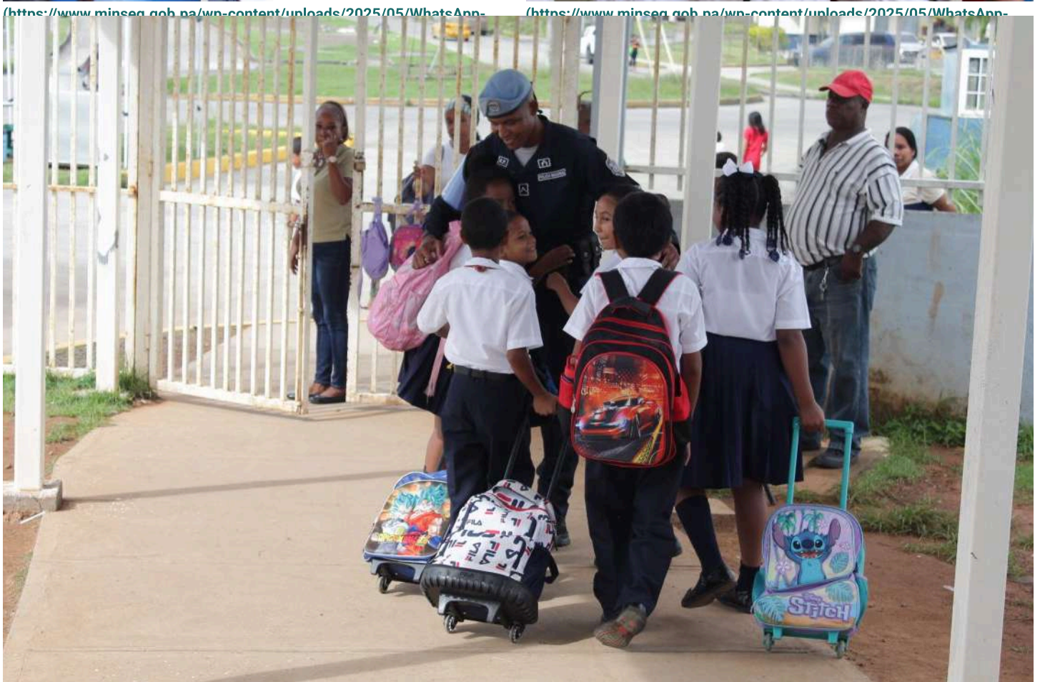
( https://www.minseg.gob.pa/wp-content/uploads/2025/05/WhatsApp-Image-2025-05-27-at-2.11.56-PM-2.jpeg )