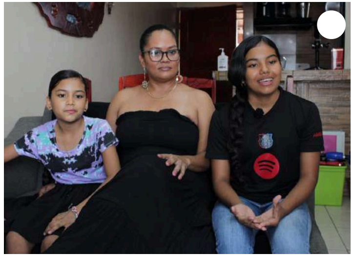
( https://www.minseg.gob.pa/wp-content/uploads/2025/05/28mayo2025emir.jpeg )