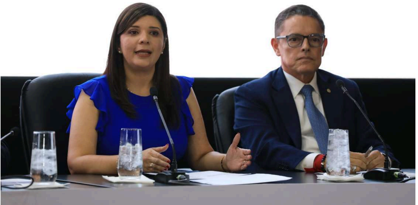
( https://www.minseg.gob.pa/wp-content/uploads/2025/05/WhatsApp-Image-2025-05-05-at-10.30.09-PM-scaled.jpeg )