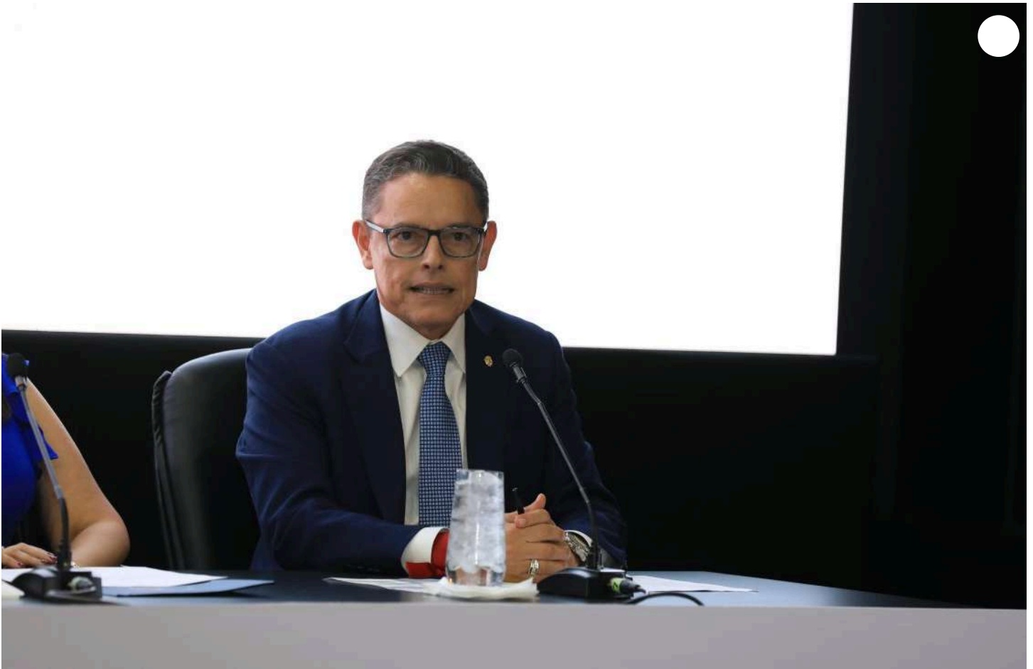
( https://www.minseg.gob.pa/wp-content/uploads/2025/05/WhatsApp-Image-2025-05-05-at-10.30.09-PM-1-scaled.jpeg )