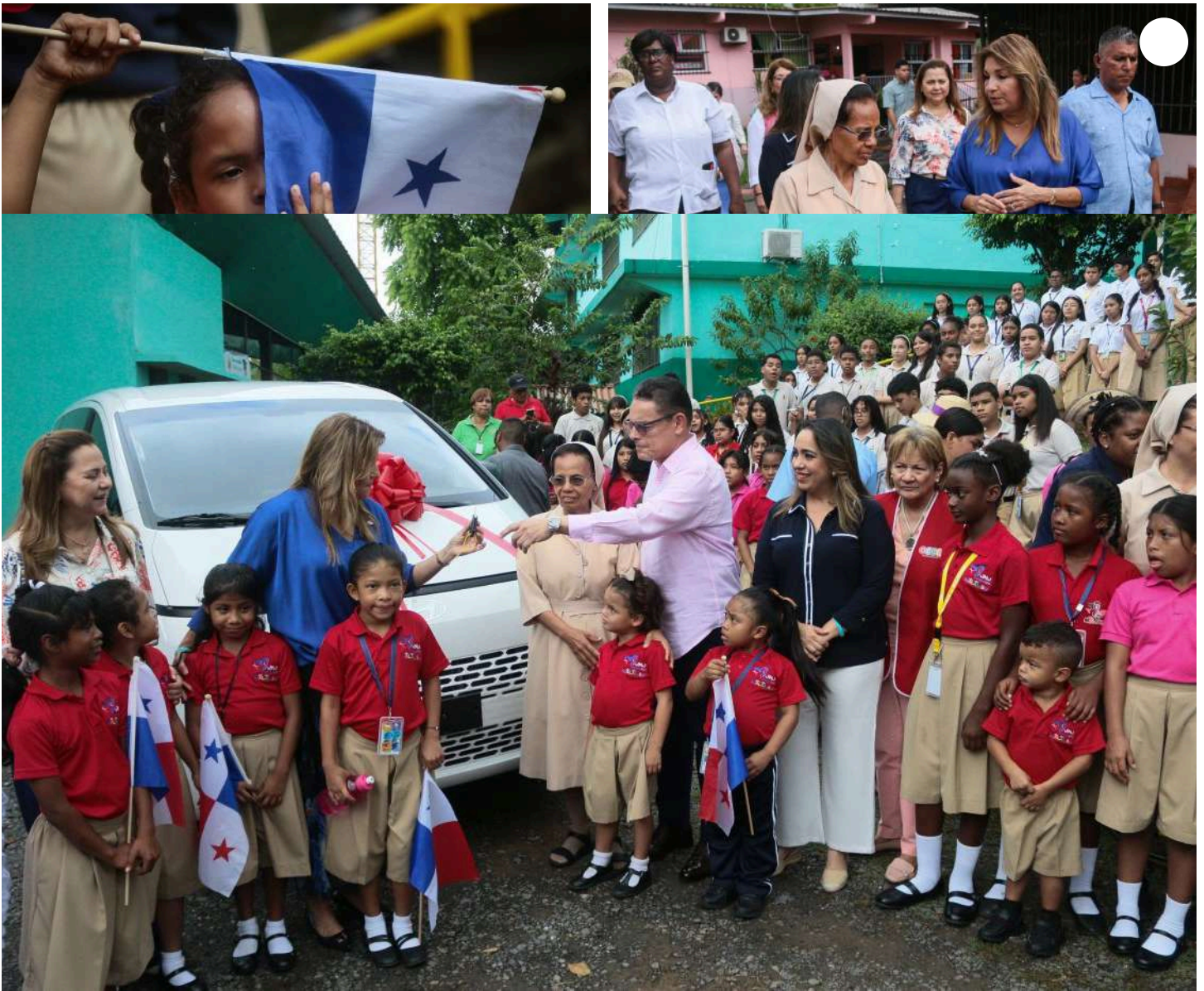
( https://www.minseg.gob.pa/wp-content/uploads/2025/05/WhatsApp-Image-2025-05-07-at-1.57.46-PM-scaled.jpeg )