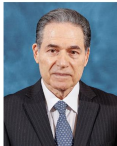
ARISTIDES ROYO S. PRESIDENTE