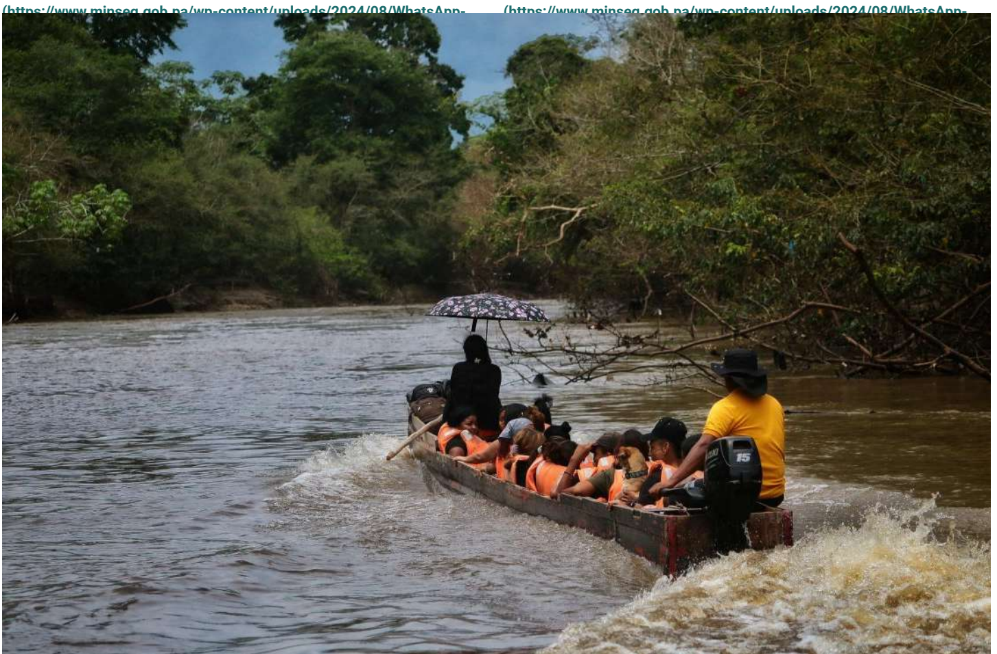
( https://www.minseg.gob.pa/wp-content/uploads/2024/08/WhatsApp-Image-2024-08-25-at-11.31.33-AM-scaled.jpeg )