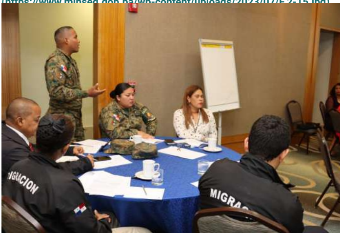
( https://www.minseg.gob.pa/wp-content/uploads/2023/07/F.4-14.jpg )