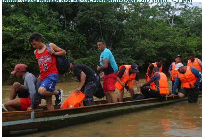
( https://www.minseg.gob.pa/wp-content/uploads/2023/08/F.5.jpg )