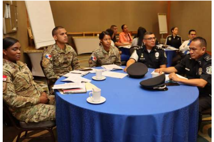
( https://www.minseg.gob.pa/wp-content/uploads/2023/07/E.3-15.jpg )