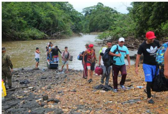
( https://www.minseg.gob.pa/wp-content/uploads/2023/08/F.3-1.png )