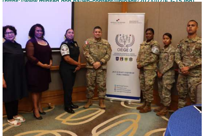
( https://www.minseg.gob.pa/wp-content/uploads/2023/07/F.5-14.jpg )