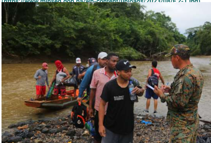
( https://www.minseg.gob.pa/wp-content/uploads/2023/08/F.4-1.jpg )