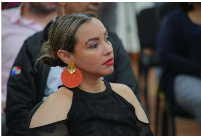
( https://www.minseg.gob.pa/wp-content/uploads/2023/08/F.2-1.png )

Recientemente el ministro de Seguridad Pública, Juan Manuel Pino, dijo que según las estadísticas de este año, se prevé que a fin de año atraviesen Darién más de 400 mil personas.