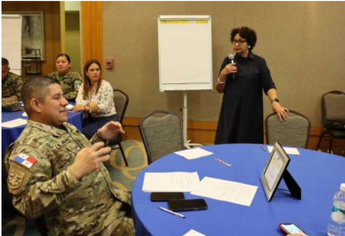
( https://www.minseg.gob.pa/wp-content/uploads/2023/07/E.2-15.jpg )

Por el BID se contó con el apoyo de la consultora Dinis Luciano, quien aportó en estos talleres “ escuchó cómo es el abordaje de los estamentos de seguridad a las víctimas de violencia.