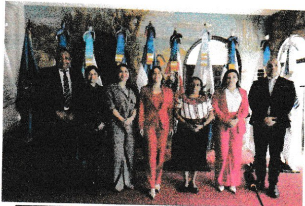
Reunión con Las Ministra del Consejo de Ministra de Centroamerica y república Dominicana