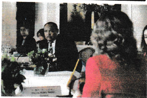
Representación de Panama, con Las Ministra del Consejo de Ministra de Centroamerica y república Dominicana