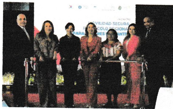
Corte de cinta el lanzamiento político del proyecto "Movilidad Segura: Protocolo Regional para mujeres migrantes"